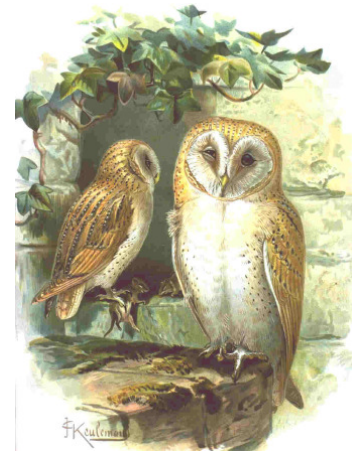
Naumann Naturgeschichte der Vögel Mitteleuropas

Die Schleiereule ernährt sich vorwiegend von Kleinnagern, vor allem der Feldmaus. Vögel nehmen nur einen geringen Teil des Nahrungsspektrums ein. Zur Jagd auf Feldmäuse braucht sie offene Kulturlandschaften, bevorzugt Dauergrünlandflächen und Streuobstwiesen. Nur in diesem Umfeld macht es auch Sinn, Nisthilfen anzubringen.