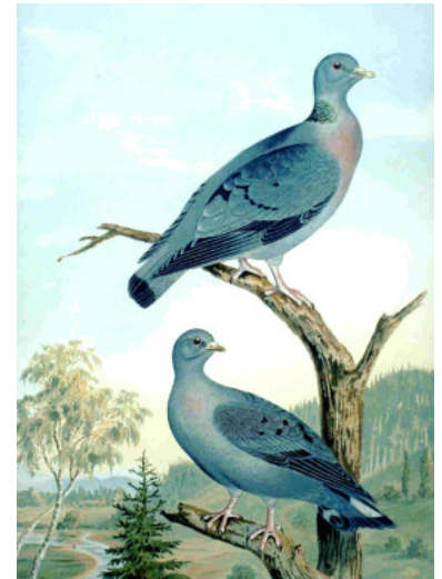
Naumann Naturgeschichte der Vögel Mitteleuropas

Der Kasten kann in einer Höhe ab 4 m mit Öffnung in Richtung Ost/Südost an einer ruhig gelegenen Pappelreihe, an Einzelbäumen in Knicks oder im lichten Wald an Bäumen angebracht werden. Der Anflug muss frei sein. Nistmaterial bringen die Tauben selbst ein. Hohltauben brüten auch in Kolonien. Von daher brauchen die Abstände zum nächsten Nistkasten nicht zu groß zu sein. Bewohner der Nistkästen sind auch Dohlen und der Waldkauz. Der Kasten sollte jährlich im Spätherbst gereinigt werden.