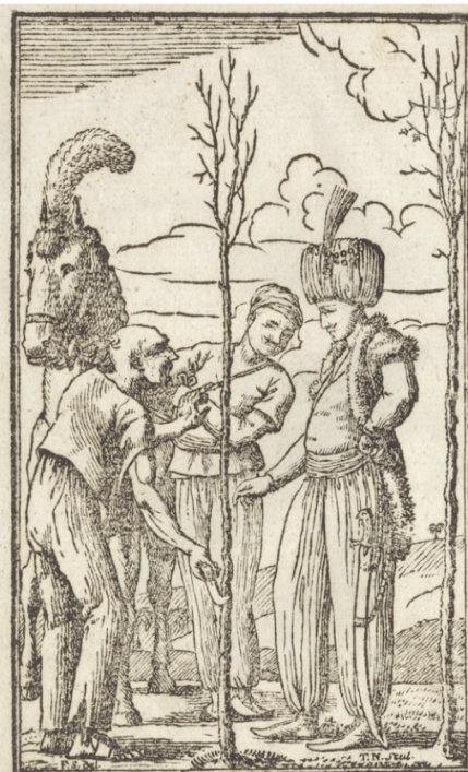
Es ist billig, daß wir thun, wie unsere Väter gethan haben; diese pflanzten Bäume, und wir essen die Früchte.

XIV Wortrede. Ein persischer Kalif (einer der mächtigsten Potentaten in Asien) traf einmahl, als er auf der Jagd war, einen alten Mann an, der einen Apfelbaum pflanzte. Der Kalif und alle die mit ihm waren, lachten über den Mann, daß er einen so nützlichen Einsfall hatte, in seinem hohen Alter einen Obstbaum zu pflanzen, gerade als wenn er noch ein Jüngling wäre, und die Früchte von diesem Baum genießen würde. Darum gieng der Kalif auf den Mann zu, und fragte ihn, wie alt er sey? — Herr, antwortete der Greis, ich bin über achtzig Jahre, aber Gottlob, noch so gesund und munter wie einer von dreißigen. — Aber, fragte der Kalif weiter, wie lange gedenkest du noch zu leben, daß du in einem so hohen Alter noch junge Bäume pflanzest? du wirst ja wohl die Früchte davon nicht mehr genießen wollen; warum machst du dir eine so vergebliche Mühe und Arbeit? — Herr, gab