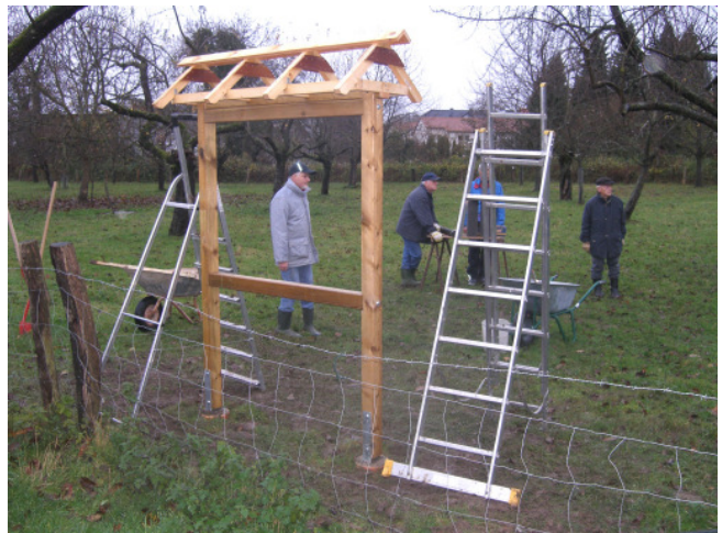
Aufstellen des Holzgerüsts