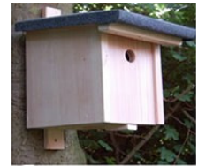
Geschenk 2: Nistkasten