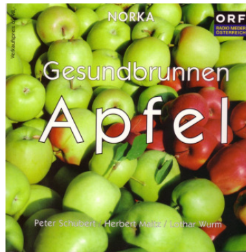
Werbepremie: Gesundbrunnen Apfel

Berücksichtigt werden alle Neuanmeldungen für den BUND, die bis zum 31. Dezember 2011 eingehen.