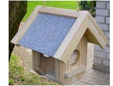
Geschenk 3: Futterhaus