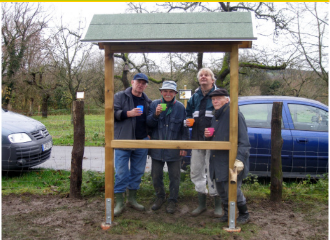
oben: Endlich ein Dach über'n Kopf unten: Tafel Lebensraum Streuobstwiese