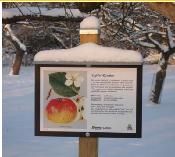
Härtetest im Winter