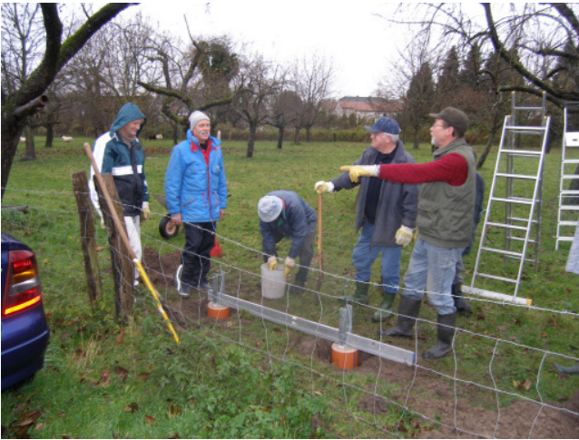
Ausrichtung der Fundamente