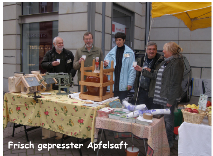
Frisch gepresster Apfelsaft

In der Lindenhauswiese wurde der lange vorbereitete Obstsortenlehrpfad mit finanzieller Unterstützung der Umweltstiftung Lippe eingerichtet (siehe Seiten 13/14).