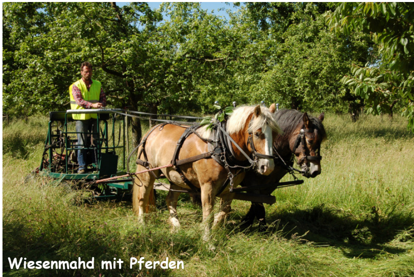
Wiesenmäh mit Pferden