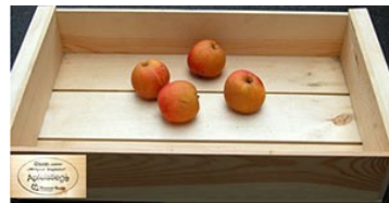
Geschenk 1: Apfelstiege