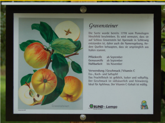
Obstsortentafel für den Gravensteiner