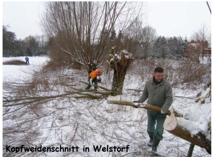
Kopfleiden in Welstorf

Die Feldhecken wurde auf einer Länge von jeweils 25 m auf den Stock gesetzt. Mit den Ästen des Obstbaumschnitts wurden die Benjes-Hecken in der Lindenhauswiese ausgebessert.