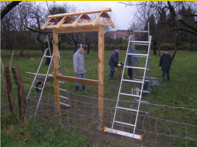
oben: Der Dachstuhl ist montiert unten: Durch- und Einblicke