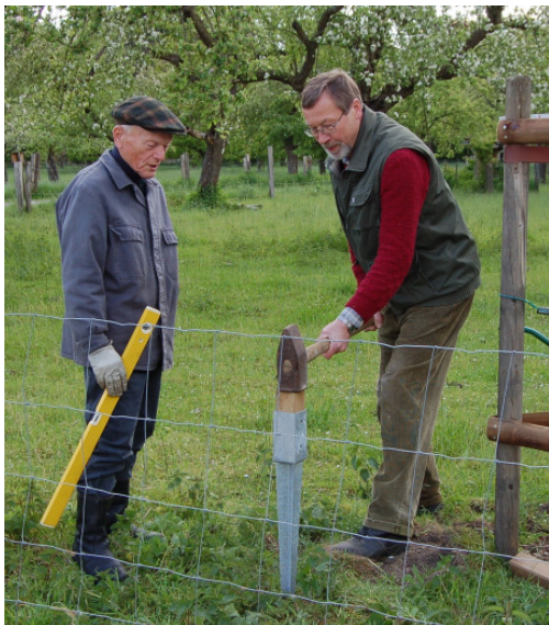
Einschlaghülse für Pfosten