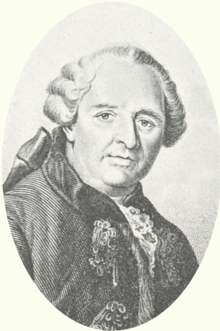
Henri Louis Duhamel du Monceau