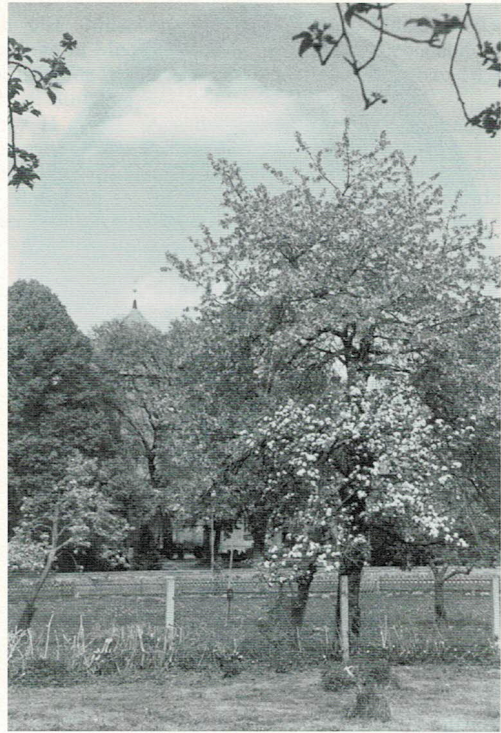
Abb. 2 Pfarrobstgarten in Belitz