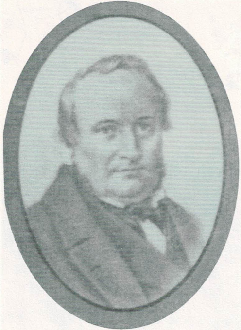
Abb. 3 Johann Georg Bogislav Müschen (1812–1897)

Patriotischen Landwirthschaftlichen Vereins unter dem Titel: „Beschreibung der älteren und neueren Kern- und Steinobstsorten, die sich sicher und mit Nutzen im nördlichen Deutschland anpflanzen lassen“. In den Jahren 1826 bis 1828 folgten weitere Teile, die auch Beschreibungen von Traubensorten und anderen Beerenfrüchten enthielten.