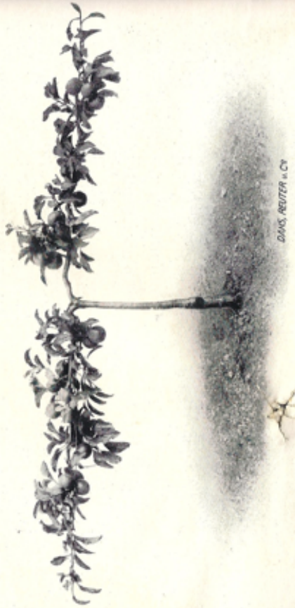
Wagerechter Schnurbaum, 2armig