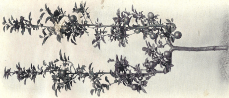
DAHS, REUTER u. Co.

Starkwüchsige, namentlich flachkronige Apfel- und Birnen-Hochstämme zeigen in gutem Erdreich nach etwa 50 Jahren bis 10 Meter Kronenausdehnung, in flachgründigem, kiesigem oder steinigem Boden 7 bis 8 Meter und können ein Alter von 80 bis 100 Jahren erreichen. Steinobstbäume sterben schon nach 30 bis 40 Jahren ab mit einem Kronendurchschnitt von 4 bis 6 Meter. Obstpyramiden und Buschbäume haben in 20 bis 30 Jahren, je nach der Bodenart 5 bis 6 Meter Kronenbreite. Eine zweckmäßige Pflanzung ist Kernobst mit Buschblümen oder Steinobsthochstämmen als Zwischenpflanzung.