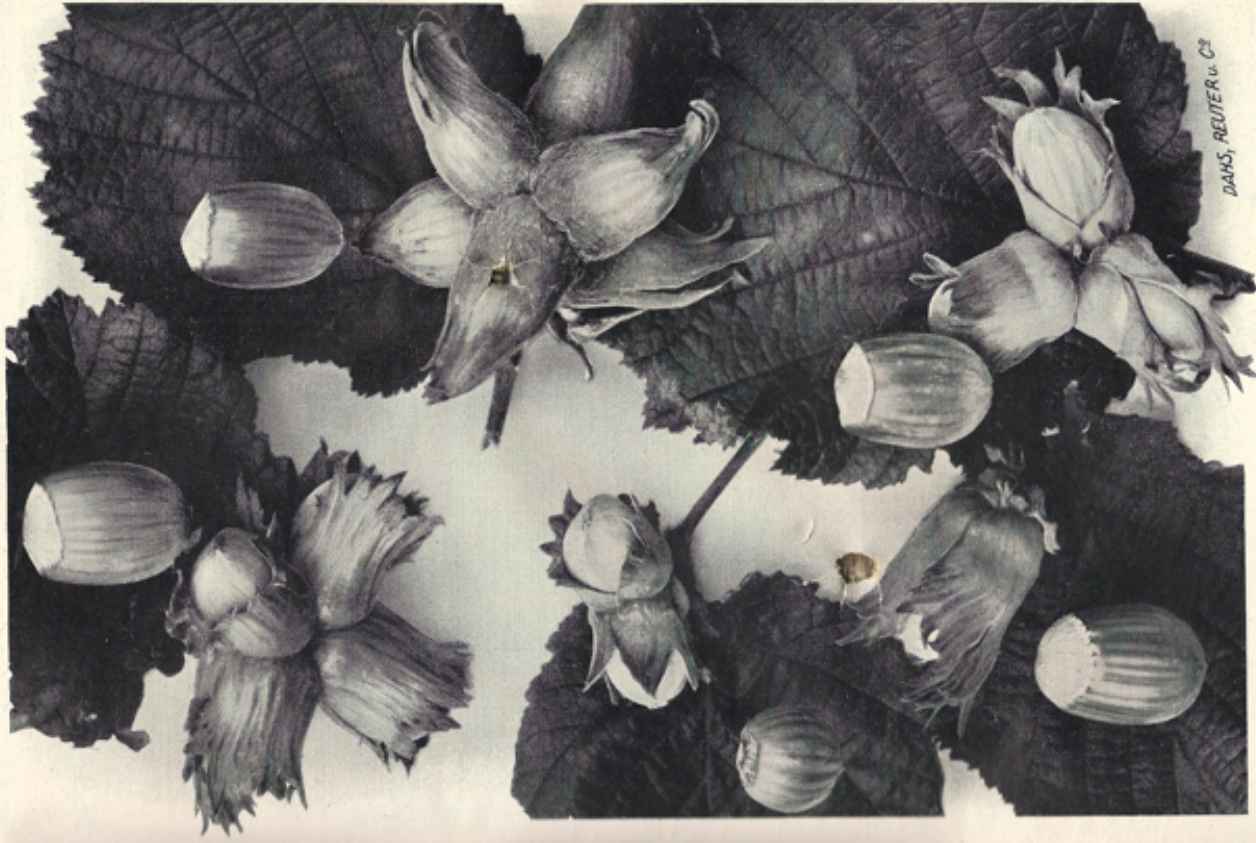
Mitte links : Haseinuß von Mehl Unen : Cosford