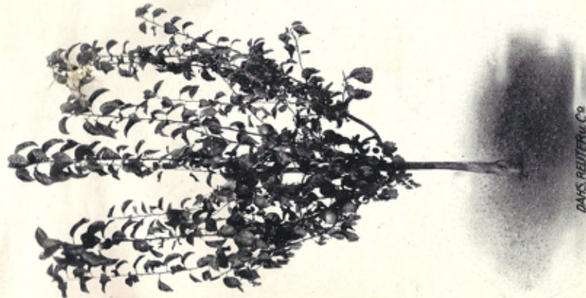
Buschform, 3 bis 4-jährig