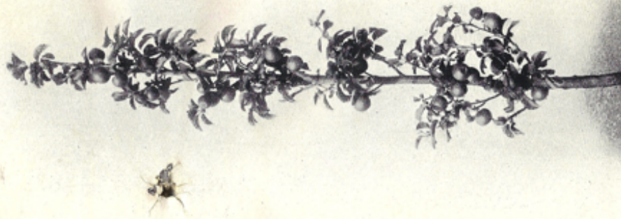
DAHS, REUTER & CO.

kommt Lage und Bodenart der Pflanzstelle zuerst in Betracht, sodann die beabsichtigte Verwendungsart, ob Tafelobst für jeden Monat des Jahres oder gangbarste Marktware. In diesen verschiedensten Fragen stehen wir mit unserer langjährigen Erfahrung gerne zu Diensten. Wichtig ist ferner, die Bestellungen möglichst früh aufzugeben, weil selbst die größte und leistungsfähigste Baumschule in der späteren Saison nicht mehr alles nach Wunsch wird liefern können. Empfehlenswert ist auch, stets eine oder mehrere Sorten zum Ersatz mit anzugeben für den Fall, daß irgend eine der zunächst gewünschten Sorten nicht mehr vorhanden ist. Der Hochstamm wird dort bevorzugt, wo intensive Unterkulturen betrieben werden, ferner an Wegen und auf Viehweiden. Der Halbstamm gestattet ebenfalls Unterkulturen durch Handbetrieb, eignet sich zur Bepflanzung von Abhängen und Böschungen. Pyramide und Buschbaum tragen sehr bald und sind für Edelobstzucht unentbehrlich. Beide Formen eignen sich für geschlossene Obstplantagen ohne Unterkulturen, ferner für Rabatbepflanzung. Die verschiedenen Spalterformen werden an Mauern, Hauswänden, freistehenden Spalter-