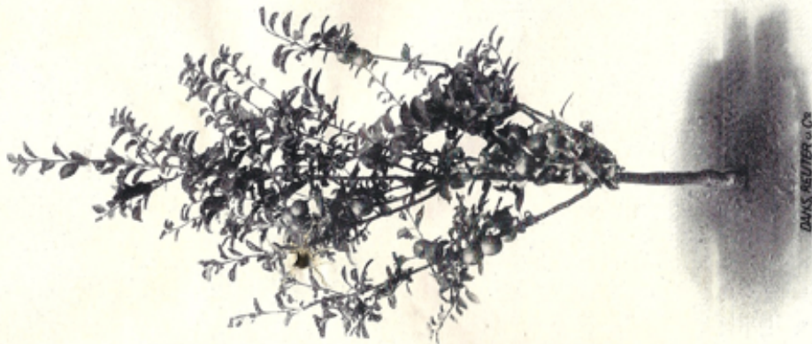
Pyramide mit 3 Serien