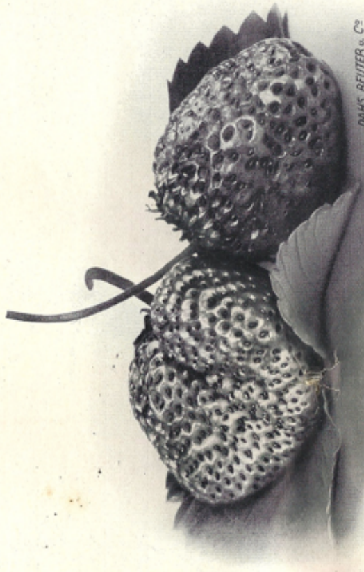
DAHS, REUTER u. Co