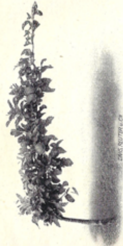
DAHS, REUTER & CO.