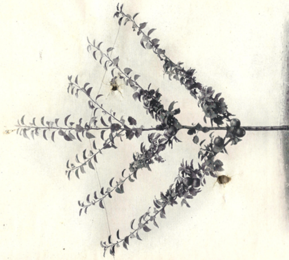
DAHS, REUTER u. Co.